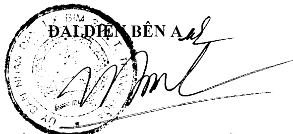
PHÓ CHỦ TỊCH UBND THỊ XÃ Tống Thanh Bình

3. Hợp đồng có 4 trang được lập thành 10 bản có giá trị Pháp lý như nhau, Mỗi bên giữ 01 bản, các bản còn lại gửi đến các đơn vị liên quan./.